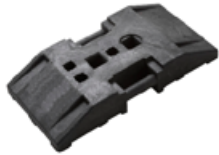
Beschwerungsgewicht Recyclingplatte groß