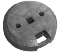
Beschwerungsgewicht Recyclingplatte klein